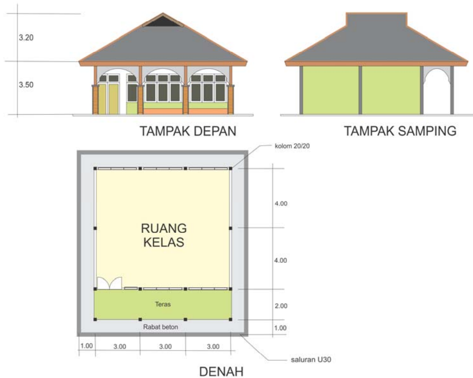
Gambar 4.1. Model Bangunan Objek Kajian

konvensional dan konstruksi non konvensional. Selanjutnya dari penghitungan dilakukan perbandingan untuk dibuat kesimpulan dan rekomendasi.