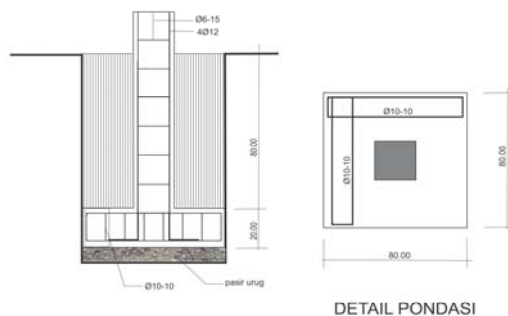
Gambar 5.3 Desain Pondasi Footplate

Konstruksi pondasi adalah pondasi setempat footplate terbuat dari beton dengan komposisi 1PC, 2 PS, 3 Kr, dengan kaki berbentuk bujur sangkar ukuran 0,8 cm x 0,8 cm tebal 20 cm, kedalaman penampang berbentuk trapezium dengan ketinggian 80cm. Jumlah konstruksi pondasi footplate 14 bh.