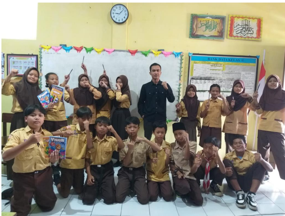
Gambar 2. Foto bersama peserta didik kelas VI SD N Tuntang 02